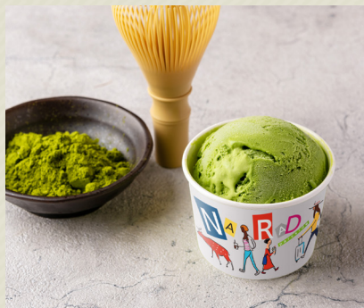
大和抹茶 Matcha Tea