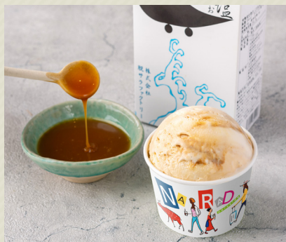
塩キャラメル Salted Caramel