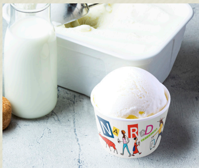
淡路ミルク Awaji Milk