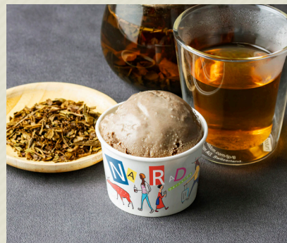
ほうじ茶 Hojicha Tea